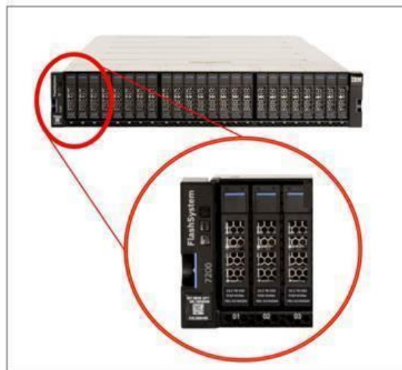
Figure 2 IBM FlashSystem 7200 bezel and IBM FlashCore Module description

Como pode ser observado na arquitetura da IBM por exemplo que utiliza controladoras e flash core modules, os equipamentos podem ser fornecidos com uma ou duas controladoras (“canisters”) independentemente de quantos flash core modules serão utilizados.